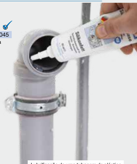
Lubrificação de uma tubagem de plástico